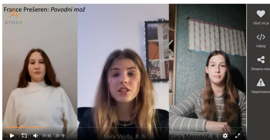
🔗 Prireditev ob kulturnem prazniku, februar 2021

Ko se je prireditev končala, smo bili ponosni in hkrati veseli, kako dobro se je vse skupaj odvijalo. Tega se takrat nismo zavedali, a žal je bila to zadnja prireditev v živo pred izbruhom Covid-19. Vse skupaj je bila čudovita izkušnja, iz katere sem se veliko naučila in bi jo z veseljem še kdaj ponovila. Upamo, da ste v prireditvi uživali tudi vi, vsaj malo, tako kot smo mi, ki smo jo pripravljali.