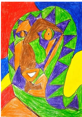
Nuša Krapša, 5. b.