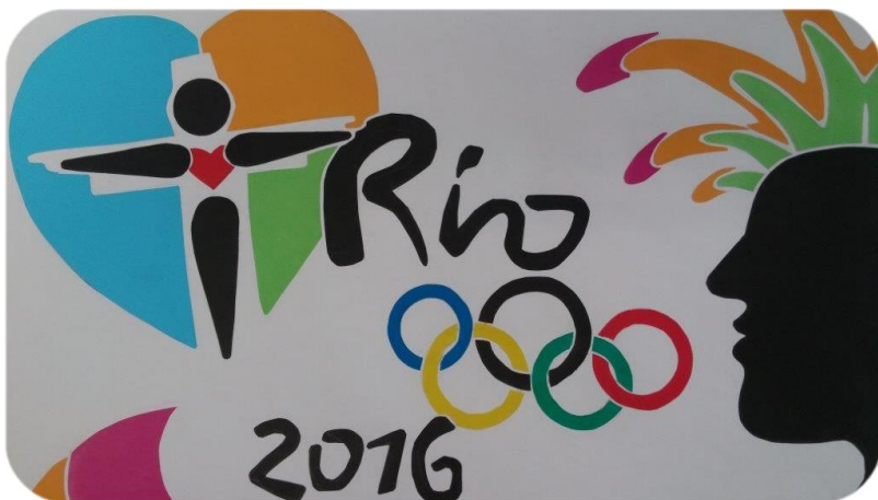
Vida Glaz, 8. c