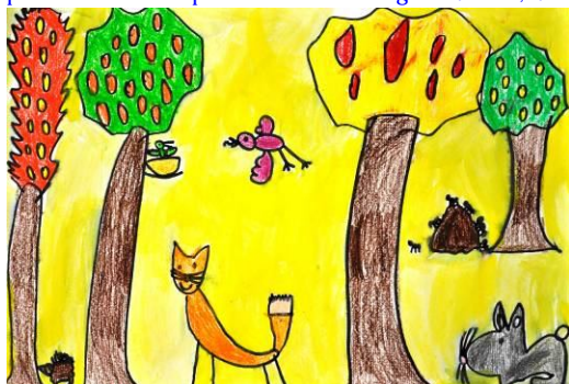
Gaia Rhea Majcen, 1. b

je to tako prizadelo, je sklenil da naredi samoumor. Tako je svet izgubil edino priložnost, da bi v njem zavladala mir in pravica. Od takrat naprej se je ohranil kapitalizem in svet se je začel rušiti. Še danes je tako in svet je nepravilčen in ima veliko problemov.