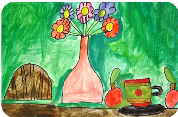
Gaj Vinter, 3. b