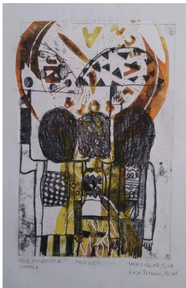
Kaja Petrovič (8. b) in Tara Ciglar (7. b)