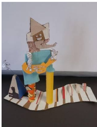
Špela Čuš in Špela Belšak, 9. a