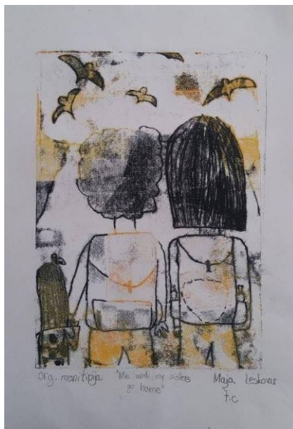
Maja Leskvar, 7. c