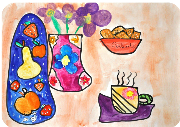
Vita Slana, 3. b