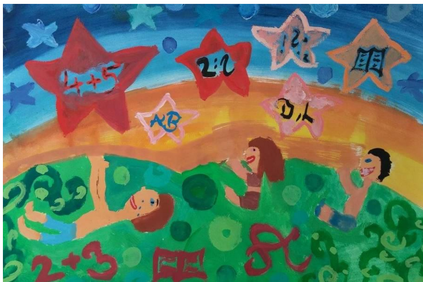
Klara Kristl, 7. b