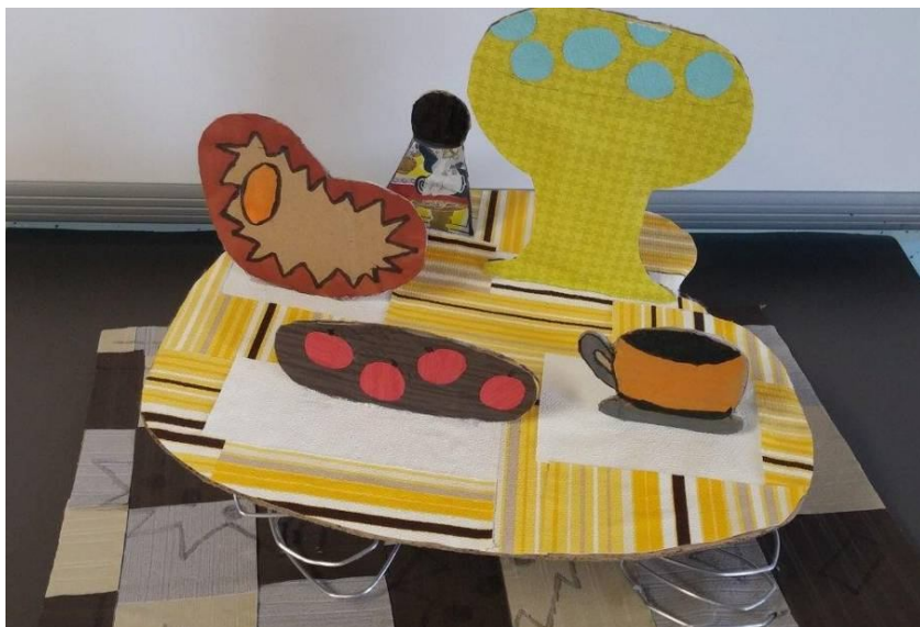
Sabina Peklar in Mišel Cizerl, 9. b