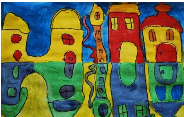
Špela Čuš, 4. a