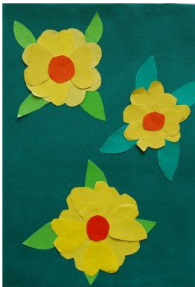
Sabina Peklar, 4. b