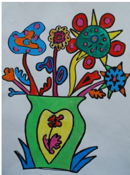
Vida Glatz, 5. c

Elizabeta: Kaj se še lahko zgodi, tam doli, pod gradom?