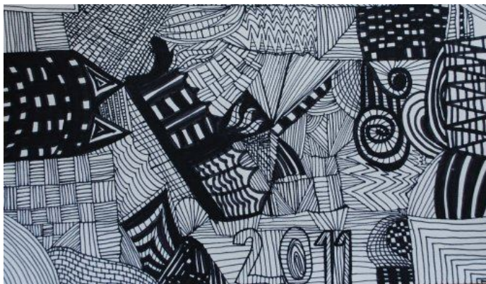
Nik Leskovar, 4. b