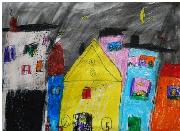
Eva Žlahtič, 1. a