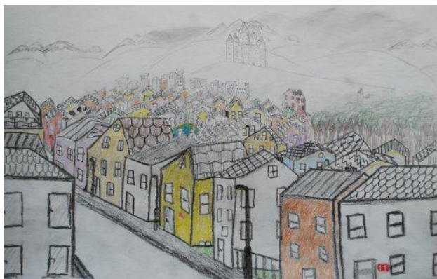
Tomí Petek, 8. b