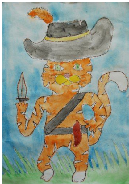
Sara Glatz, 4. a