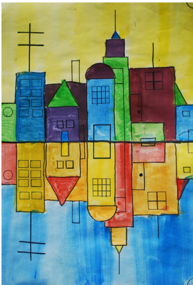
Vita Pernat, 4. c