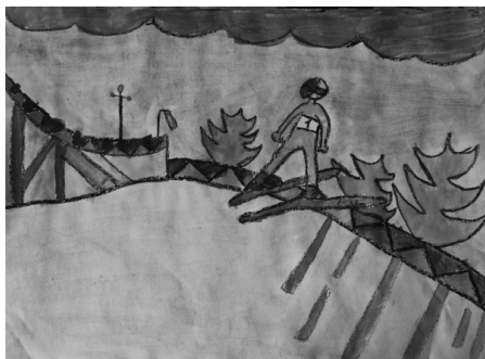
Urh Toš, 5. c

S sestro sva prevzeli skrb zanjo. Strinjam se s starši, da je skrb za psička zelo odgovorna naloga, vendar je za tako ljubko žival, kot je naša Bella, zelo prijetno skrbeti. Zelo sem vesela, da sem jo dobila.