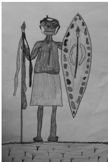
Žiga Letonja, 5. c