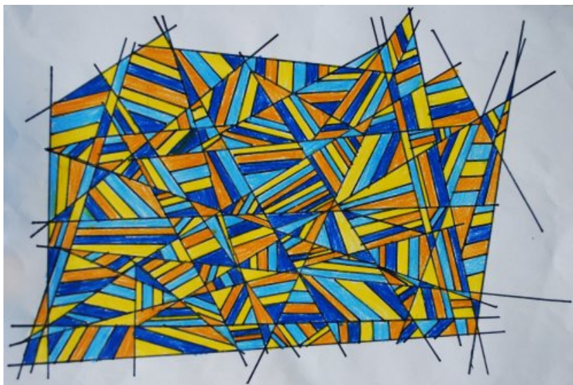
Urban Gnilšek, 4. c