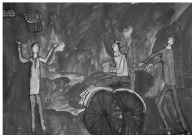
Nejc Herjavec, 2. a