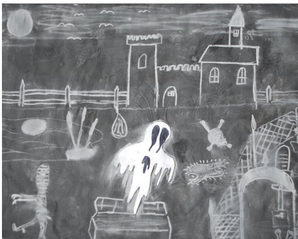
Tilen Žagar, 4. c