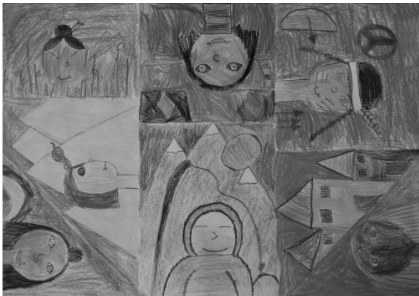
Lana Kolarič, 3. c