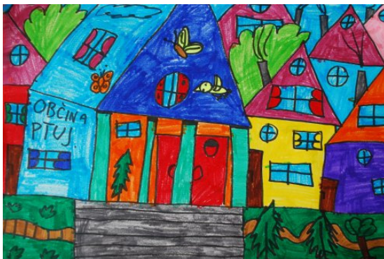
Zarja Škrjanec, 3. b