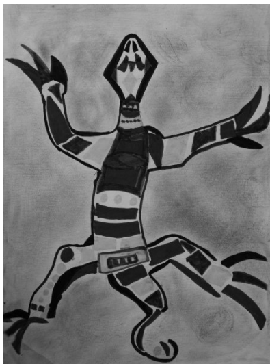
Jure Lesjak, 5. c

Na nogometnem igrišču so se zbrali fantje. Bili so razdeljeni v dve ekipi: zelene in rdeče. Rdeči so kmalu po začetku igre dali gol in zeleni golman je postal zelo žalosten. Rdeči nogometaši so prišli k njemu in ga potolažili. Potem so nadaljevali igro.