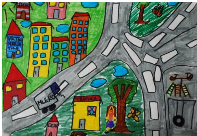
Pia Panič, 3. b