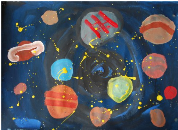
Vita Solina, 3. c