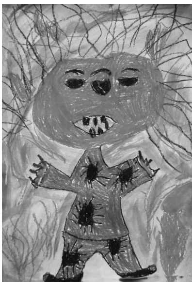
Danaja Ficjan, l. b