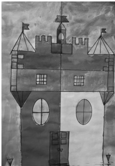
Let Lovse, 4. c