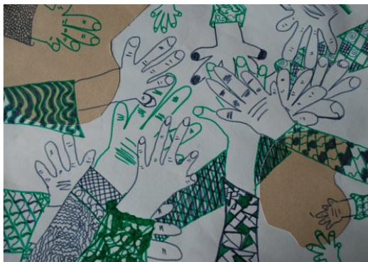
Sofija Tatjanko-Živko, 6. b